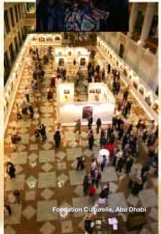
Fondation Culturelle, Abu Dhabi