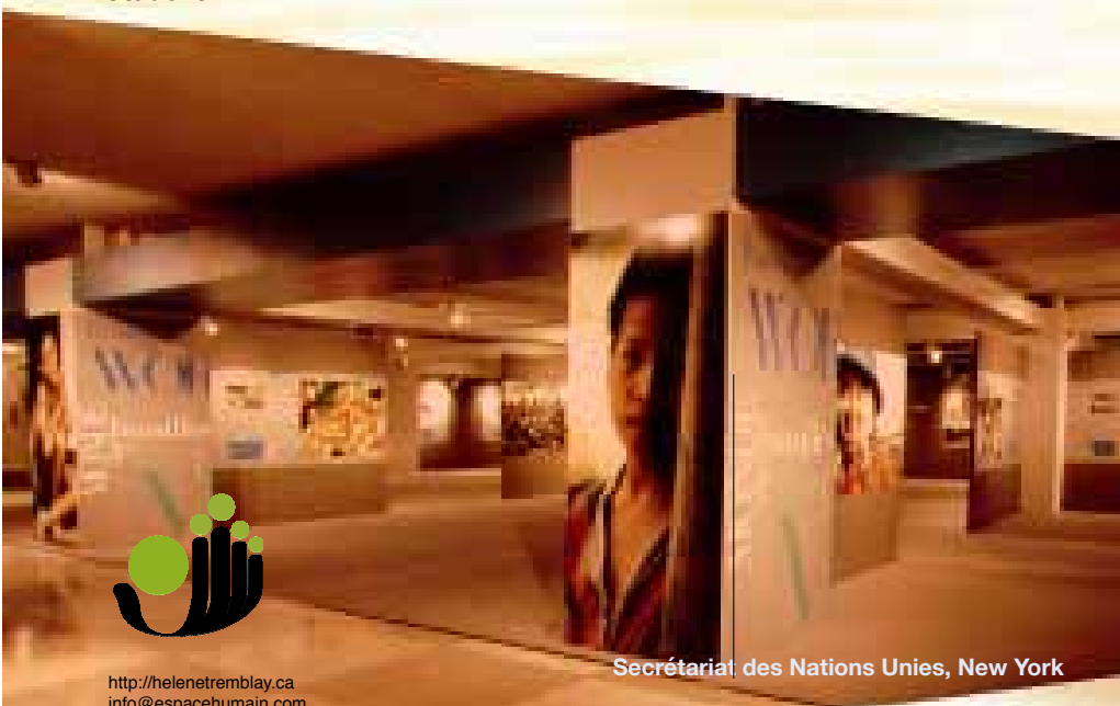
Secrétariat des Nations Unies, New York